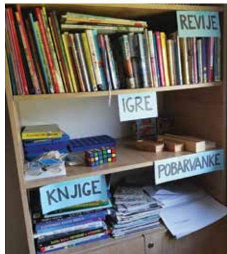
Slika 1: del domske knjižnice

V ČŠOD Fara poleg navedenih aktivnosti spodbujamo tudi branje, saj imamo domsko knjižnico, s katero podpiramo bralno kulturo. Na knjižni omari čaka učence kup poljudno-znanstvenih in leposlovnih knjig in zbirka različnih revij (npr. Pil, Gea, National Geographic, Ciciban, Solnica). V šolskem letu 2023/24 smo prek donacij knjižnice Mirana Jarca Novo mesto knjižno omaro posodobili z leposlovljem za večinoma mlajše učence (1. triado OŠ) ter z nekaj leposlovnimi deli za starejše osnovnošolce. Učencem so knjige na voljo ves čas bivanja, največ jih uporabljajo med počitkom, pred spanjem ali med prostim časom.