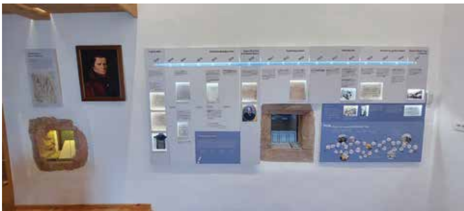
Razstava v Čopovi hiši

Na poti kulturne dediščine je Prešernova rojstna hiša tista, ki jo učenci najbolj poznajo, pogosto se njenega obiska tudi najbolj veselijo. Učenci imajo izmed vseh v uvodu omenjenih velikih mož največ predznanja prav o našem največjem pesniku, kar pa ni veliko presenečenje, glede na to, da je Prešeren močno prisoten v celotni vertikali našega izobraževalnega sistema. K temu zagotovo pripomore tudi dejstvo, da vsako leto, na dan njegove smrti, praznujemo Prešernov dan. Na kulturnem dnevu si z učenci ogledamo Prešernovo rojstno hišo, v