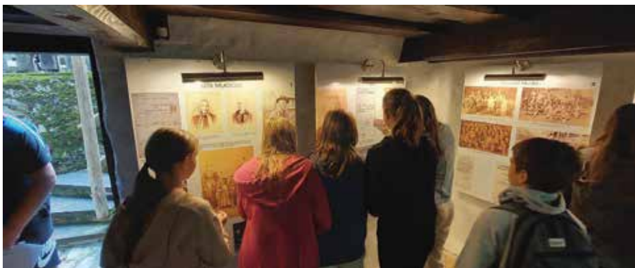
Učenci med fotolovom v Finžgarjevi rojstni hiši

vasi Vrba pa si ogledamo še pesnikov spomenik, cerkev svetega Marka in vaško lipo. Po koncu ogleda učencem naročimo, naj si izberejo pet ključnih besed, s katerimi bi povzeli ogled Prešernove Vrbe. Učenci jih naštejejo, nato pa dobijo navodilo, da morajo vseh pet besed uporabiti v pesmi. V skladu s Strategijo za spodbujanje bralne pismenosti (2023) je kreiranje in pisanje novih (umetnostnih) besedil eden izmed najvišjih ciljev, ki naj bi ga učenci dosegli. Z izborom ključnih besed si učenci delno tudi že določijo temo, o kateri bodo pisali. Največkrat si izberejo ključne besede, kot so: France