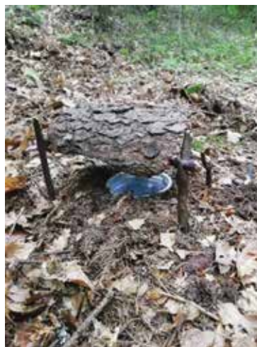
Slika 2: Raziskovalna talna past

tudi povedo, kje v besedilu so imeli pri razumevanju težave, to skupaj razložimo ter jih odpravimo.